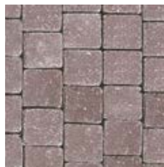
TESTA DI MORO